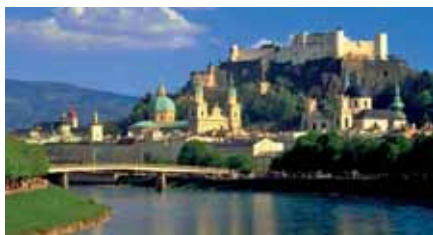
Morava a Čechy v 8. a první polovině 9. století náležely do misijní působnosti bavorského arcibiskupství s metropolí v Salzburku.

opakovaně do Bohemie vstoupila franská vojska Karla Velikého, aby si porobila zdejší slovanské kmeny. Jistě se výpravy účastnili i zástupci církve, ať jako polní kněží vlastního křesťanského vojska či jako misionáři. Obě tažení vedená Karlovými syny Karlomannem (805) a mladším Pipinem (806) směřovala od západu patrně po Ohři a dotkla se Luckých držav v severozápadní části české kotliny. Hlavní útok byl soustředěn na hrad zv. Canburg , jehož poloha je dosud neznámá a nejčastěji bývá přisuzována hradišti Kanina na Kokořínsku severovýchodně od Mělníka. Po dva roky opakovaného plenění se Slované poddali a zavázali se hradit Frankům tribut. Lokalita budoucí Prahy byla s největší pravděpodobností stranou obou ničivých vpádů, o misijním „úspěchu“ tažení neexistují ve franských letopisech žádné písemné zmínky a nemáme ani žádné archeologické nálezy, které by podobný vliv naznačovaly.