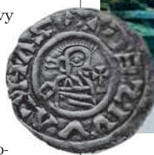
Denár knížete Boleslava s nápisem Wissegrad

Společně s pojmenováním Pražanů se název hradu Praha pozvolna přenesl na celou sídelní aglomeraci budoucího města, přesto zde po další staletí přetrvávají místní názvy jako Malá Strana, Staré Město, Na Rybníčku, Vyšehrad... Původní bavorskou misíí zaznamenaný název Wissegrada tak zůstává přítomen pouze v jediném jménu někdejší soustavy vojvodských hradišť, jako bájný Vyšehrad se stal především součástí tradic a funkčním článkem opevnění středověkého města. ■